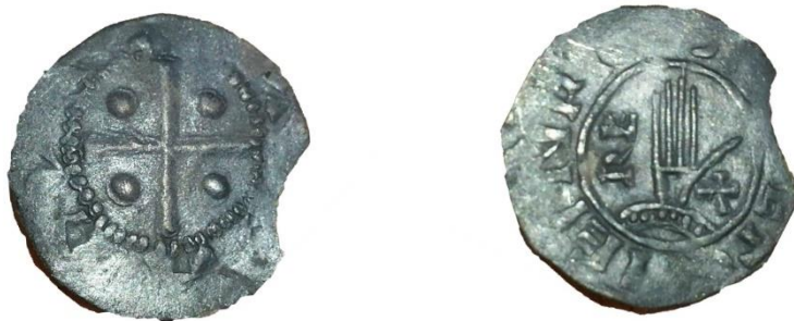
Figuur 2 Denier van Hendrik II

Vrijwel identieke munten zijn ook in Deventer geslagen door Adela van Hamaland (973-1018). Dichter bij Hamaland zijn we nog niet eerder geweest in ons onderzoek.