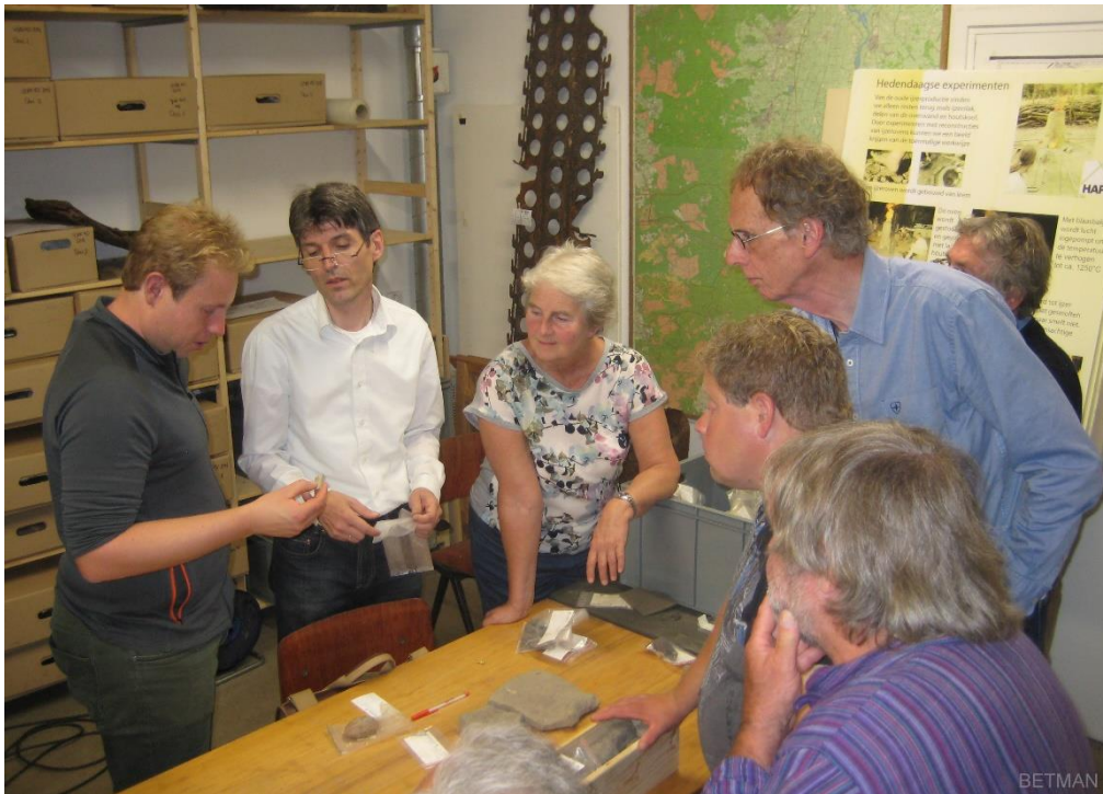
Figuur 1 Determinatie aardewerk uit Terwolde door Emile Mittendorff

Een bijzondere vondst van dezelfde akker werd gevonden door een jongeman uit de buurt. Hij vond een zilveren Denier, geslagen in Deventer tijdens Hendrik II (1002-1024).